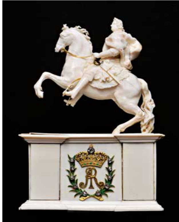
Abb. 2 (rechts) Reiterstatuette Augusts des Starken, Dresden, um 1715/20

und durch Diebstähle oder widerrechtliche Entnahmen große Verluste zu verzeichnen. Aber immer wieder gelangen spektakuläre Rückerwerbungen. Bei einer Elfenbeinstatuette August des Starken 5 (Abb. 2), dem »Gothaer Elefanten« (Abb. 3) – ein barockes Trinkspiel 6 –, und der kostbaren Sprüngli-Schale 7 (Abb. 4), erfolgten sie gemeinsam mit der Kulturstiftung der Länder, dem Bund, dem Land Thüringen oder weiteren Stiftungen, wie der Rudolf-August Oetker-Stiftung. Immer wieder förderte die EvSK auch alleine, wie beim Rückerwerb eines Löwenaquamaniles des frühen 14. Jahrhunderts 8 (Abb. 5) oder dem Porträt des burgundischen Herzogs Philipp des Guten aus der Nachfolge des Rogier van der Weyden 9 (Abb. 6). Beim Wiederankauf der wertvollsten Teile der einzigartigen Gothaer Münzsammlung 10 (Abb. 7), die nach Kriegsende nach Coburg verbracht worden waren, führte Martin Hoernes – damals noch für die Kulturstiftung der Länder – die komplizierten Verhandlungen mit dem Haus Sachsen-Coburg und Gotha. Die EvSK finanzierte damals den Landesanteil des Kaufes vor. Eine weitere Vorfinanzierung für die Kulturstiftung der Länder ermöglichte 2007 den Rückerwerb eines Rhinozeroshornbechers 11 (Abb. 8). Es bestanden also enge und tragfähige persönliche Verbindungen der Ernst von Siemens Kunststiftung nach Gotha, auf die Oberbürgermeister Kreuch bauen konnte.