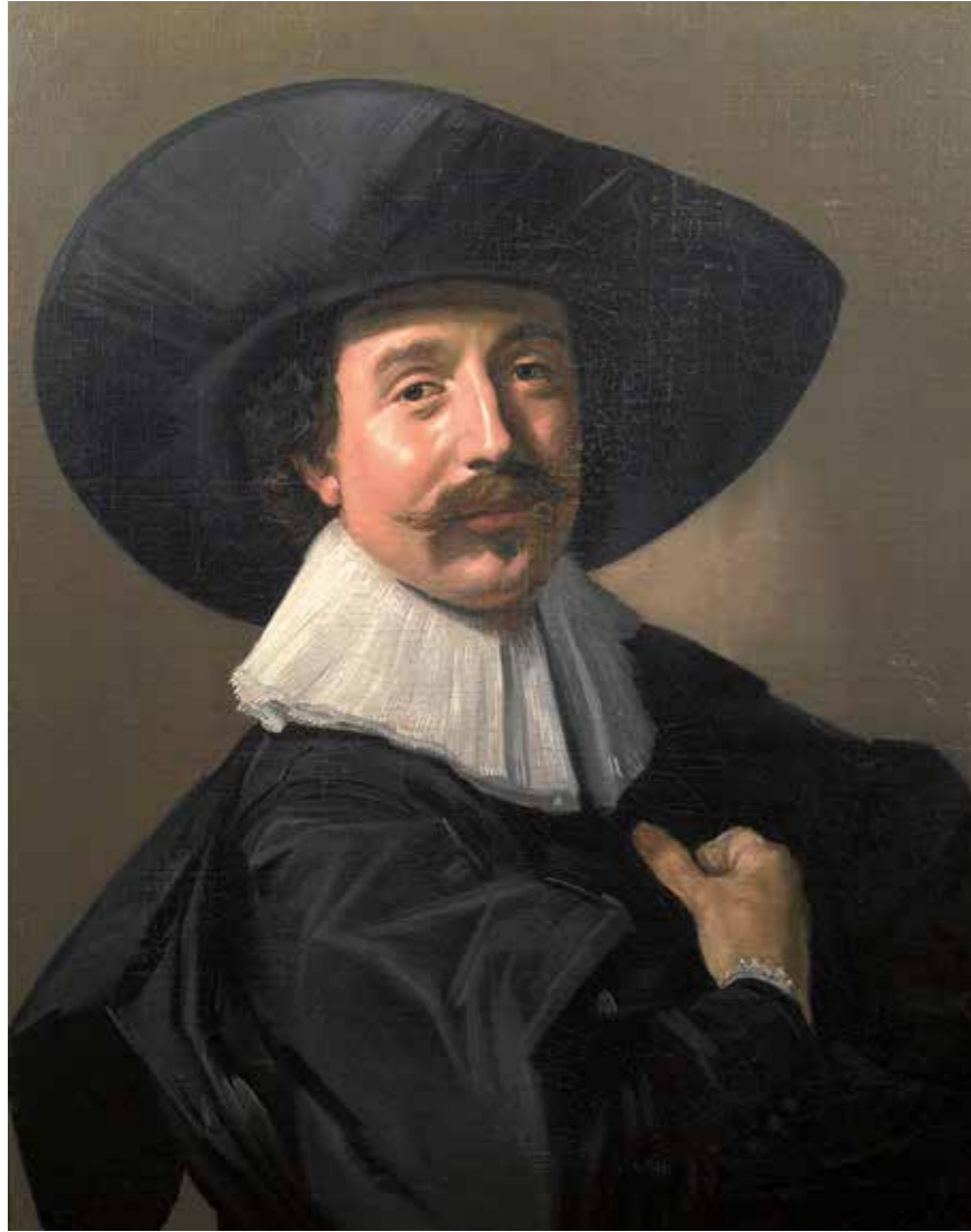
Abb. 13 Frans Hals, Brustbild eines unbekannt Herrn mit Hut und Hand- schuhen, um 1535

Vergleichssumme wurde dem Anwalt der Erbgemeinschaft angeboten und die Einschätzung der eigenen rechtlichen Position deutlich gemacht: Die Anbieter hätten nie Eigentum erworben, da sie immer von der Herkunft aus einem Diebstahl wussten, die »Vereinbarung« sei so nicht wirklich wirksam und zudem seien Besitzer und Eigentümer nun identisch. Eine telefonische Kontaktaufnahme der EvSK direkt mit dem nach Berlin gekommenen Vertreter der Erbgemeinschaft wurde durch deren Anwalt abgeblockt. Die über Mail, Telefon, Briefe und schließlich in großer Runde in Gotha geführten Verhandlungen liefen sich fest – der Anwalt und anscheinend auch seine Mandanten waren nicht an einer gütlichen Einigung auf einem niedrigerem finanziellen Niveau interessiert.