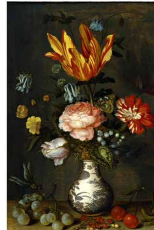
Abb. 22 Balthasar van der Ast, Blumenstrauß, 1628

Vielleicht sind sich manche Käufer auch heute nicht immer über die Herkunft eines zu erwerbenden Werkes im Klaren und deshalb bereit, einen hohen Liebhaberpreis zu zahlen – für ein Stück, mit dessen krimineller Herkunft sie eigentlich nichts zu tun haben wollen und dessen Wiederverkaufsmöglichkeiten deshalb natürlich deutlich eingeschränkt sind. Im professionellen Kunsthandel sind heutzutage gestohlene Werke nicht mehr zu verkaufen, da Datenbanken und das Internet zahllose Recherchemöglichkeiten bieten.