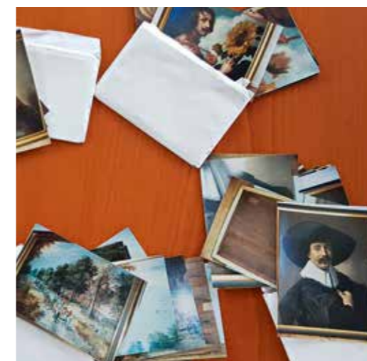
Abb. 9 Briefumschläge mit den ersten Farbfotos der gestohlenen Gemälde