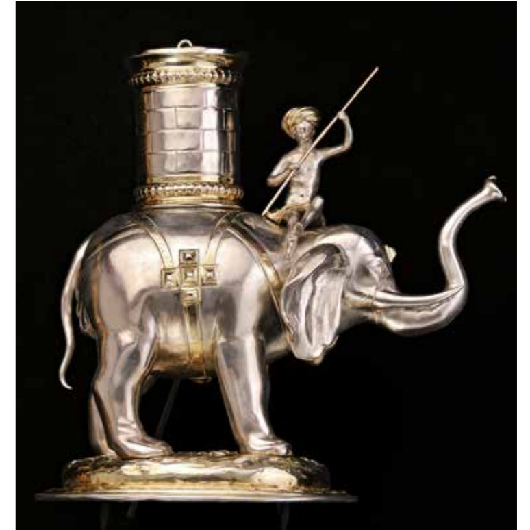
Abb. 3 Simon Wickert, Trinkgeschirr in Gestalt eines Elefanten, Augsburg, um 1699/1700