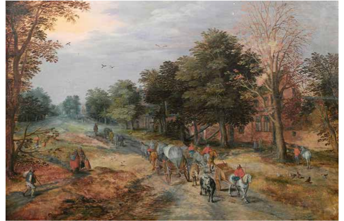
Abb. 12 Jan Brueghel d. Ä. (Werkstatt?), Landstraße mit Bauernwagen und Kühen, um 1610