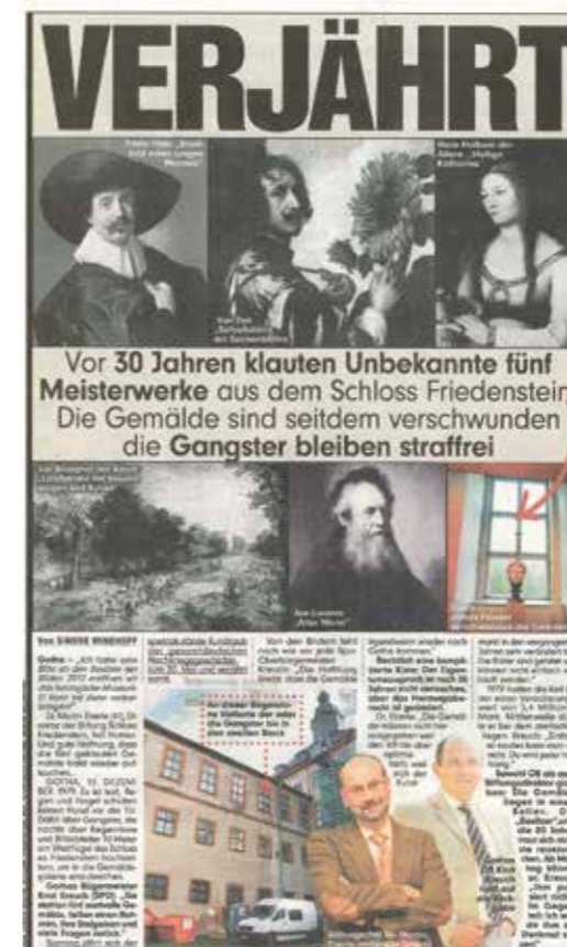
Abb. 10 BILD vom 11.12.2009