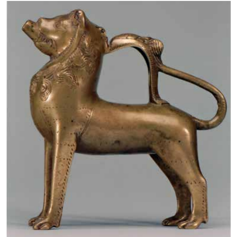
Abb. 5 Löwenaquamanile, Thüringen, frühes 14. Jahrhundert