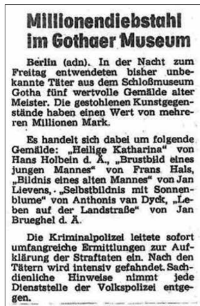
Abb. 16 Neues Deutschland vom 15.12.1979

abgeholt und mit viel Glück unentdeckt über die Grenze in die BRD gebracht. Die im August 2020 öffentlich gewordenen Ermittlungen der Polizei und von Journalisten haben die Vermutung der EvSK bestätigt. 17 Es handelte sich um einen Täter ohne Kunstsachverstand, der ein zufällig zusammengekauftes Bilderkonvolut zunächst über viele Jahre im verborgenen hielt und dann abseits der üblichen Vermarktungswege an Freunde weitergab.