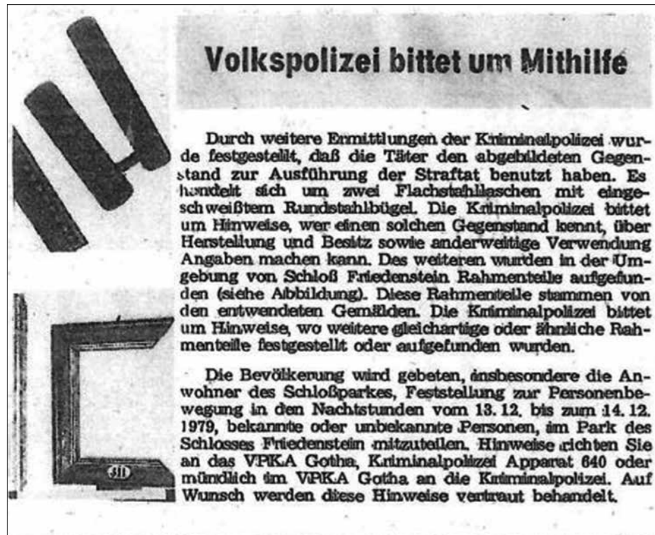
Abb. 17 Thüringer Landeszeitung vom 18.12.1979