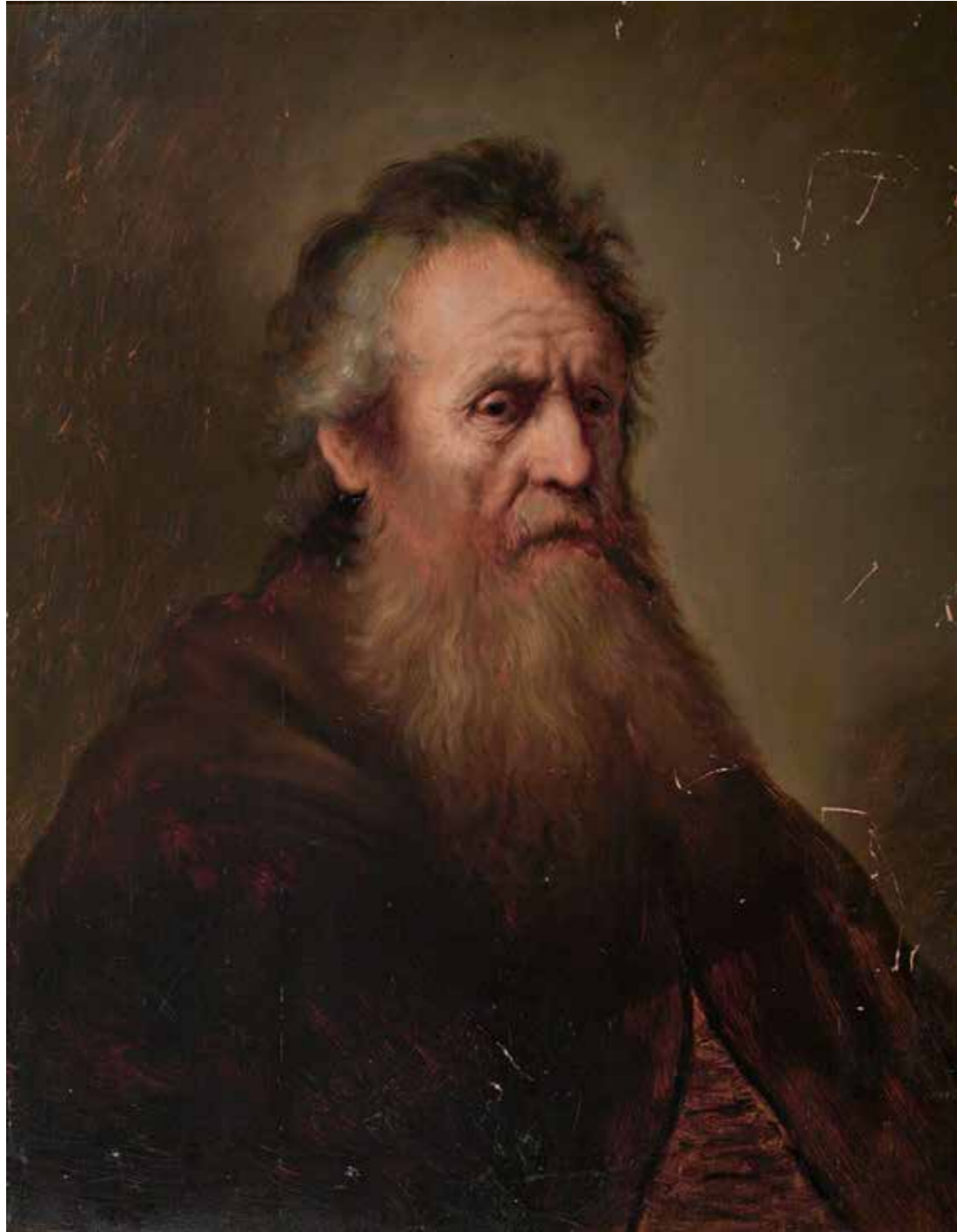
Abb. 15 Ferdinand Bol, Bildnis eines alten Mannes, nach 1632