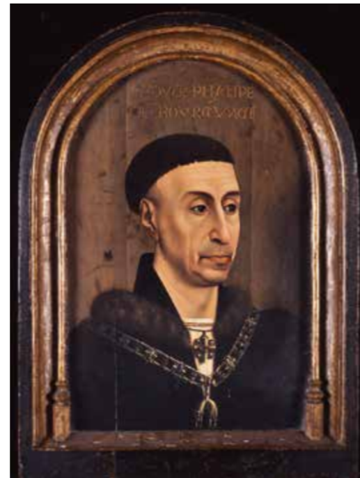
Abb. 6 Rogier van der Weyden zugeschrieben, Herzog Philipp der Gute von Burgund, um 1450

Die kriminalistische Rekonstruktion des nächtlichen Einbruchs, die umfangreichen Ermittlungen von Volkspolizei und Staats-sicherheitsdienst sind mangels echter Aufklärung des Falles mehrfach und detailliert geschildert worden, sogar ein Kriminalroman und Filmbeiträge erschienen. 13 Deshalb nur kurz die Fakten: In der Nacht zum 14. Dezember 1979 wurden fünf Altmeistergemälde aus der im zweiten Obergeschoss des Gothaer Schlosses gelegenen Gemäldesammlung entwendet. Es handelt sich – so die heute korrekte kunsthistorische Einordnung durch die von der EvSK bestellten wissenschaftlichen Fachgutachter 14 – um eine »Heilige Katharina« von Hans Holbein d.Ä., eine »Landstraße mit Bauernwagen und Kühen« aus der Werkstatt Jan Brueghels d.Ä., das »Brustbild eines unbekannten Herren mit Hut und Handschuhen« von Frans Hals, eine historische Kopie nach dem »Selbstbildnis mit Sonnenblume« von Anthonis van Dyck und das »Bildnis eines alten Mannes« vom Rembrandtschüler Ferdinand Bol (Abb. 11–15). Unmittelbar nach dem Diebstahl wurde deren Wert von den Ermittlungsbehörden mit 4,53 Millionen »Ostmark« 15 dokumentiert. In den jüngeren Presseberichten stieg ein ohne Grundlage angenommener Schätzwert allerdings bis auf 50 Millionen Euro und diese nur gegriffene Summe verfestigte sich schließlich