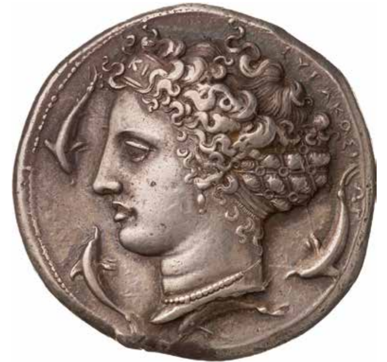
Abb. 21 Dekadrachme von Syrakus, Signatur des Kimon