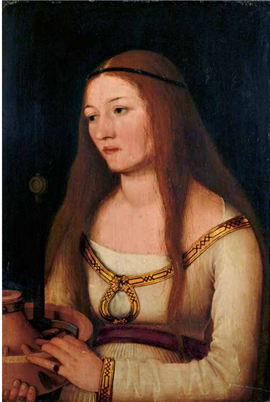
Abb. 11 Hans Holbein d. Ä., Heilige Katharina, um 1510

Sein Vater habe in russischer Kriegsgefangenschaft einen »Hans« kennengelernt, der später nach Australien ausgewandert sei. Der Sohn dieses »Hans« sei in der DDR inhaftiert worden. Daraufhin habe sein Vater, so der Unbekannte, eine Million Mark aus einer Erbschaft gezahlt, um den Mann freizukaufen. Es bleibt offen, an wen. Im Gegenzug habe er die Bilder als Sicherheit erhalten.« 27