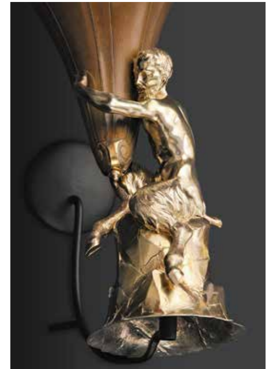
Abb. 8 Elias Adam, Rhinozeros- hornbecher mit Fuß in Gestalt eines Satyrs, Augsburg, Anfang 18. Jh.