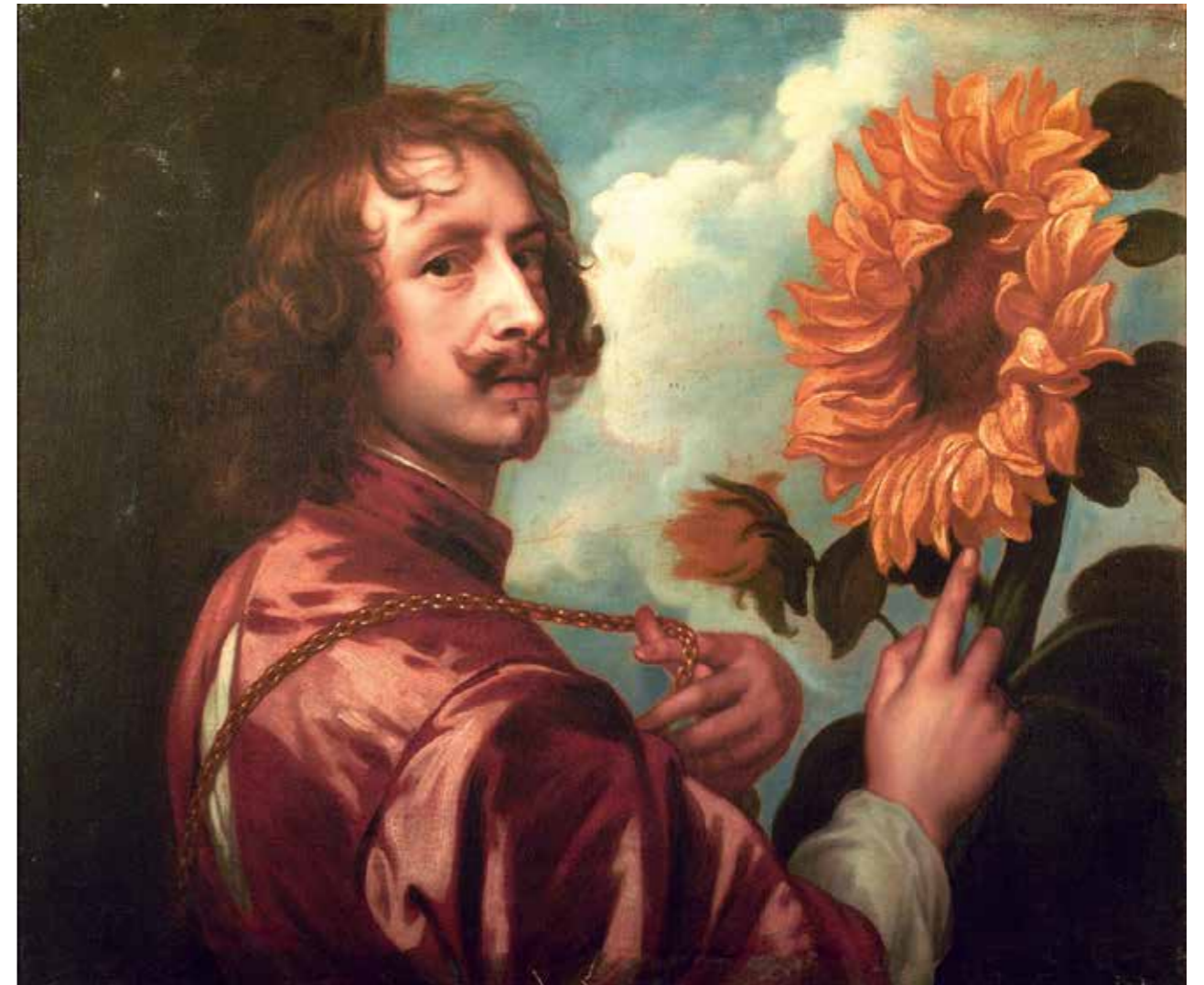
Abb. 14 Unbekannter Künstler nach Anthonis van Dyck, Selbstbildnis mit Sonnenblume, nach 1633

der Alten Meister« 28 (Abb. 23) eine gemeinsame Pressemitteilung, um ihr eigenes Handeln und die entstandene rechtliche Situation öffentlich verständlich zu machen. 29 Die nächsten Tage stand zumindest Thüringen Kopf. Der »größte Kunstraub der DDR« anscheinend aufgeklärt, die verschwundenen Bilder wiederaufgetaucht. Aber Fragen über Fragen – die niemand beantworten konnte oder wollte, denn die Verhandlungen waren noch offen, die rechtliche Situation noch nicht allseits akzeptiert und die Authentizität der Bilder noch nicht abschließend geprüft.