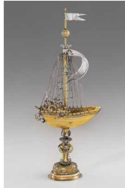
Abb. 19 (unten) Tobias Wolff, Schiffpokal, Anfang 17. Jh.

»Die Übergabe findet am Mittag statt. Kroschs Verhandlungspartner kommt allein. Man plaudert ein wenig, der Anwalt unterschreibt die Vergleichsvereinbarung, dann greift er nach seinem Handy. Gegen 13.30 Uhr beobachtet Allonges Observationsteam, wie auf der Rückseite des Instituts ein Mercedes-Transporter vorfährt. Ein Mann steigt aus, holt fünf verpackte Gegenstände aus dem Fahrzeug. Er nennt seinen Namen nicht und wirkt unsicher, aber bei den weiteren Gesprächen ist er nun dabei.