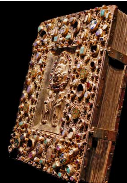
Abb. 20 Samuhel-Evangeliar, Domschatz Quedlinburg

effektive Unterstützung für Gotha, die nötige Diskretion zu wahren, professionell und Schritt für Schritt vorzugehen, um die Bilder auf alle Fälle an ihren historischen Ort zurückzubringen und wenn nötig, für die finanziellen Risiken einzustehen.