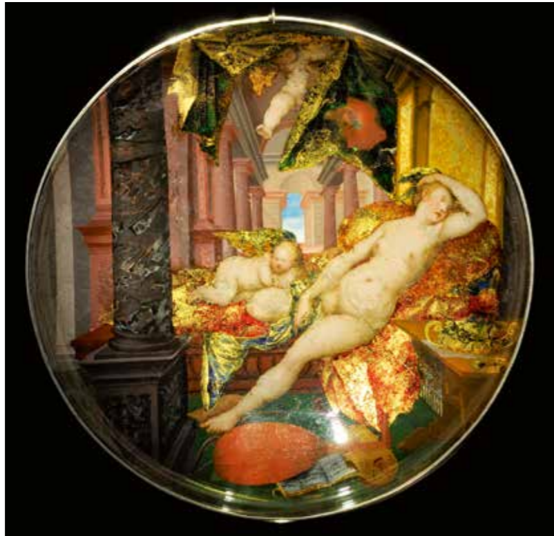
Abb. 4 Hans Jakob Sprüngli, Doppelwandschale mit Darstellung der schlafenden Venus, Zürich, um 1610-20

Die kriminalistische Rekonstruktion des nächtlichen Einbruchs, die umfangreichen Ermittlungen von Volkspolizei und Staats-sicherheitsdienst sind mangels echter Aufklärung des Falles mehrfach und detailliert geschildert worden, sogar ein Kriminalroman und Filmbeiträge erschienen. 13 Deshalb nur kurz die Fakten: In der Nacht zum 14. Dezember 1979 wurden fünf Altmeistergemälde aus der im zweiten Obergeschoss des Gothaer Schlosses gelegenen Gemäldesammlung entwendet. Es handelt sich – so die heute korrekte kunsthistorische Einordnung durch die von der EvSK bestellten wissenschaftlichen Fachgutachter 14 – um eine »Heilige Katharina« von Hans Holbein d.Ä., eine »Landstraße mit Bauernwagen und Kühen« aus der Werkstatt Jan Brueghels d.Ä., das »Brustbild eines unbekannten Herren mit Hut und Handschuhen« von Frans Hals, eine historische Kopie nach dem »Selbstbildnis mit Sonnenblume« von Anthonis van Dyck und das »Bildnis eines alten Mannes« vom Rembrandtschüler Ferdinand Bol (Abb. 11–15). Unmittelbar nach dem Diebstahl wurde deren Wert von den Ermittlungsbehörden mit 4,53 Millionen »Ostmark« 15 dokumentiert. In den jüngeren Presseberichten stieg ein ohne Grundlage angenommener Schätzwert allerdings bis auf 50 Millionen Euro und diese nur gegriffene Summe verfestigte sich schließlich